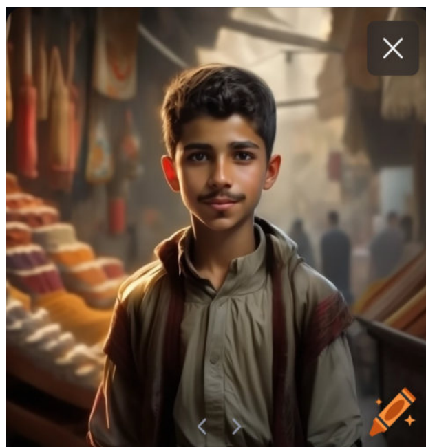
Abb.: Arbeitsproben der Dieter-Forte-Gesamtschule. Die Schüler*innen waren eingeladen, unter Verwendung von bildgenerierenden KIs eigene Porträts zu prompten.